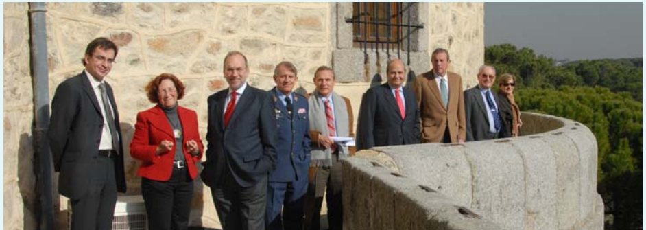
Parte del grupo de ADALEDE, en la visita al Castillo de Villaviciosa, sede del Archivo Histórico del E. del Aire.

El Archivo cuenta con más de 7.000 metros lineales de documentos, espacio que comparten sus fondos históricos, administrativos y judiciales; así como fondos cartográficos, fotográficos -240.000 negativos-, más de 4.000 películas y archivos privados y otros de interés como la reciente recepción de los fondos históricos de la empresa aeronáutica CASA.