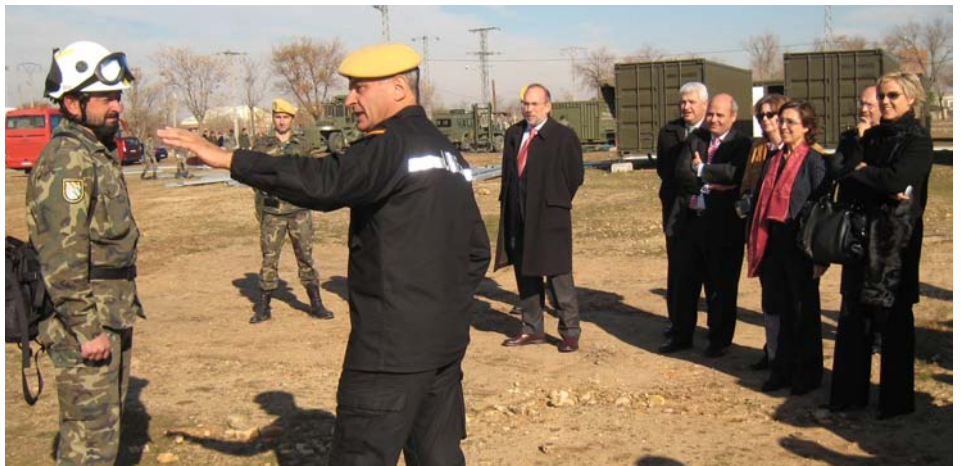
El Teniente General Coll realiza la explicación de un ejercicio práctico a los socios de ADALEDE.

Los visitantes realizaron también un interesante recorrido que incluyó la sala de Mando y Control, unidades móviles, módulos habitacionales para emergencias y asistieron a un ejercicio de lucha contra incendios.