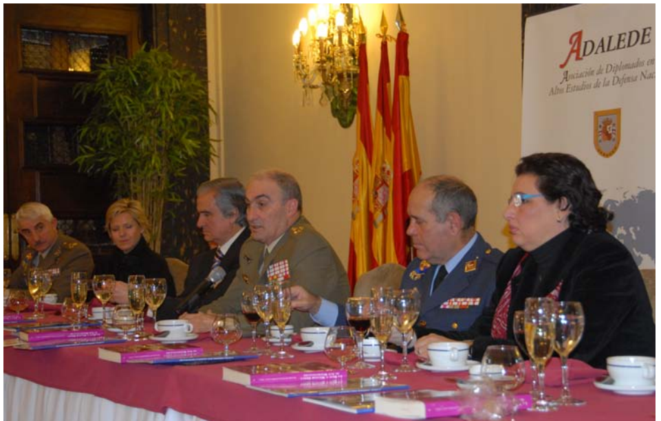
El General de Ejército, D. Carlos Villar, durante su intervención en el coloquio que siguió al almuerzo.

Durante el coloquio el JEME aportó datos de gran valor sobre la evolución de los efectivos del Ejército de Tierra, los medios de que dispone y el gran número de misiones que lleva a cabo en apoyo de las autoridades civiles.