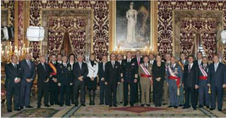
S.M. el Rey, posa con los miembros de la Junta Directiva de ADALEDE.

E l 17 de octubre de 2007, S.M. El Rey recibió en Audiencia a la Junta Directiva de ADALEDE, que fue acompañada por el JEMAD, el Director del CESEDEN y el Jefe de la EALEDE.