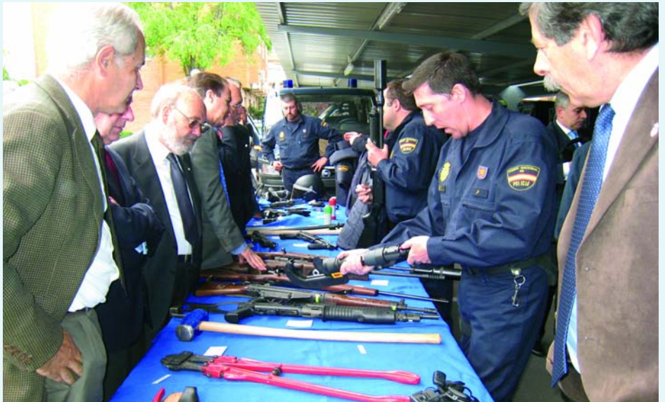
La visita permitió conocer de cerca diverso material de la policía nacional.

Los miembros de ADALEDE recibieron una completa información sobre la organización y funcionamiento del Centro, presentada de manera impecable por su Director, el Comisario