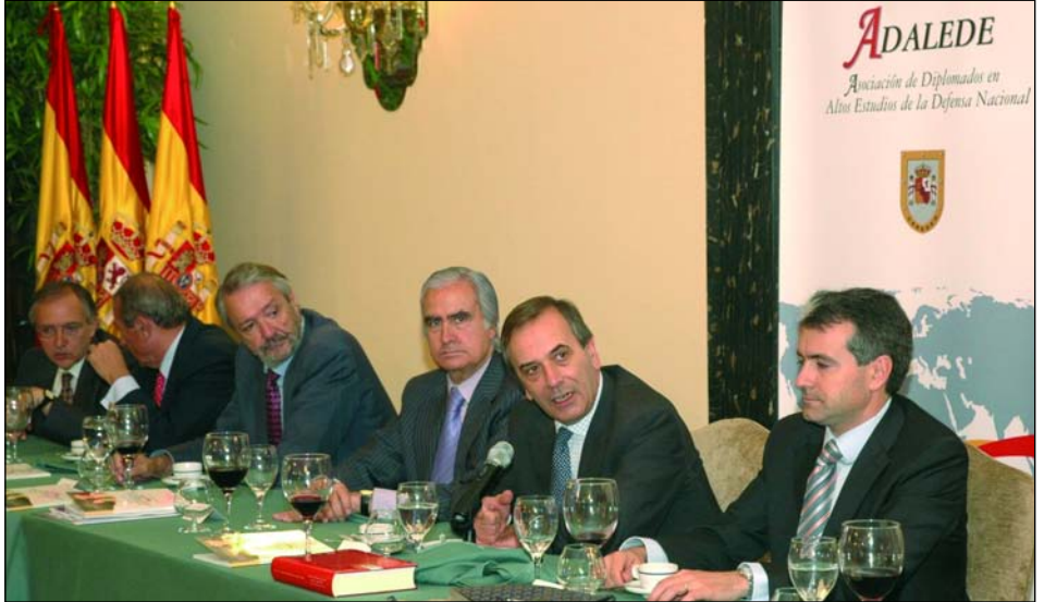
El Ministro de Defensa, José Antonio Alonso, interviene durante el coloquio.

Más de ochenta socios de ADALEDE participaron en este almuerzo en el que el Ministro recordó las importantes iniciativas legislativas impulsadas por el Ministerio en esta legislatura (Ley Orgánica de la Defensa