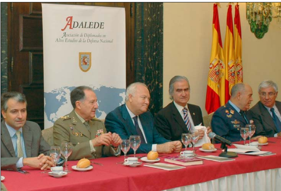
El Ministro Moratinos, acompañado por el JEMAD, el Presidente de ADALEDE, el SEGENPOL y otras autoridades

Las numerosas cuestiones que suscitó el Moderador, algunas sobre temas candentes como las relaciones con determinados países de América Latina, o la reciente filtración de conversaciones entre Presidentes de Gobierno y sus consecuencias en las relaciones internacionales, permitieron también al Ministro explicar con determinación algunas claves en la acción exterior del Gobierno.