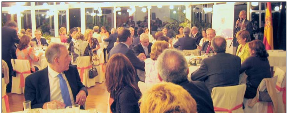
Más de un centenar de amigos de ADALEDE se reunieron en la cena de fin de curso.

Durante la cena se entregaron placas acreditativas del nombramiento de Miembros de Honor o de Mérito a distintas personas que se han destacado por su apoyo a las actividades de la Asociación.