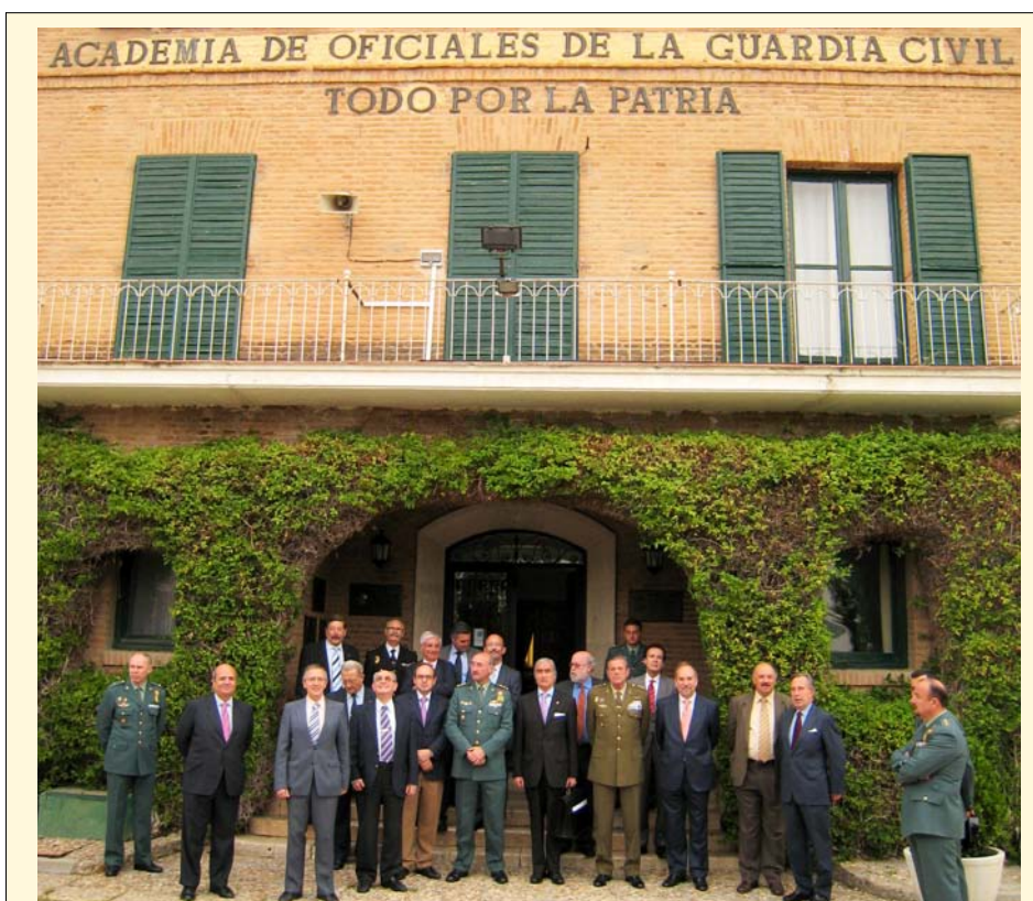
Los miembros de la Asociación posan ante la fachada de la Academia.

Todos ellos unidos a artistas como Concha Velasco o Manuel de la Cámara (del Dúo Dinámico) sumarán más de un centenar de españoles representativos de nuestra sociedad y su diversidad, personalidades de primera fila y otros muchos, menos conocidos, pero igualmente deseosos de mostrar su reconocimiento a nuestras Fuerzas Armadas y Guardia Civil.